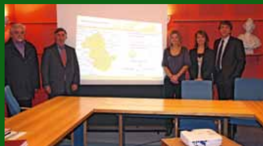
Comité de pilotage – phase état des lieux, décembre 2011

Nous intervenons essentiellement dans la phase de préparation et de construction du projet. Il y a tout d'abord une étude d'opportunité et de faisabilité d'une MSP (dans laquelle s'insère la phase d'enquête) auprès des élus, des professionnels de la santé, et de la population.